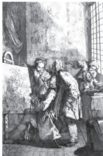
Incisione, in J.-B. Du Bos, «Riflessioni critiche sulla poesia e sulla pittura», 1770.

Le lacrime di uno sconosciuto ci commuovono addirittura prima di conoscere il motivo del suo pianto.