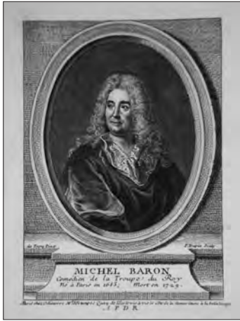
«Michel Baron», incisione di Pierre Dupin, Paris, Michel Odieuvre.

Così il piacere non viene meno anche quando la sorpresa cessa. «I quadri piacciono senza il sostegno dell'illusione, che è solo una parte del piacere ch'essi ci procurano e anche una parte abbastanza rara. I quadri piacciono, sebbene si sappia ch'essi non sono che una tela su cui con arte sono stati applicati dei colori. Una tragedia colpisce coloro che conoscono distintamente tutti gli espedienti messi in opera dal genio del poeta e dal talento dell'attore per emozionare» 93 .