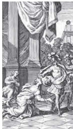
Racine, «Andromaque», Frontespizio (incisione di François Chauveau), 1668.

Il grande attore è una marionetta meravigliosa e il poeta ne tiene il filo indicandole ad ogni riga la forma precisa che deve assumere.