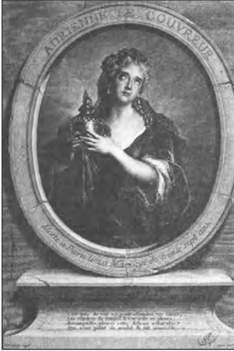
Antoine Coyvel, «Adrienne Le Couvreur interprete Corneille», 1726.

che mette in movimento l'anima genera piacere. Detto questo, però, non solo il personaggio, il suo aspetto caratterologico simpateticamente vicino al fruitore, ma anche il suo adeguato inserimento in un contesto sociale, culturale, relazionale, perfino geografico riconosciuto dal fruitore, fungono da medium dell'emozione. Du Bos lo evince osservando che ogni opera può essere compresa appieno solo nel luogo in cui viene pensata e creata (non certo, però, nel tempo, dato che i capolavori sopravvivono a lungo e vengono recuperati e riproposti in differenti epoche).