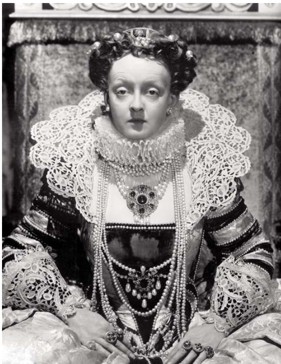
Foto di scena di Bette Davis per il film The private lives of Elizabeth and Essex (Michael Curtiz, 1939).

38 Non ho dimenticato il libretto di Giovanni Schmidt Elisabetta, regina d'Inghilterra (1815), messo in musica da Gioachino Rossini: semplicemente, l'argomento è fuori tema, poiché le vicende riguardano l'amore della regina per il conte di Leicester e fanno capo ad una tradizione del soggetto completamente diversa.