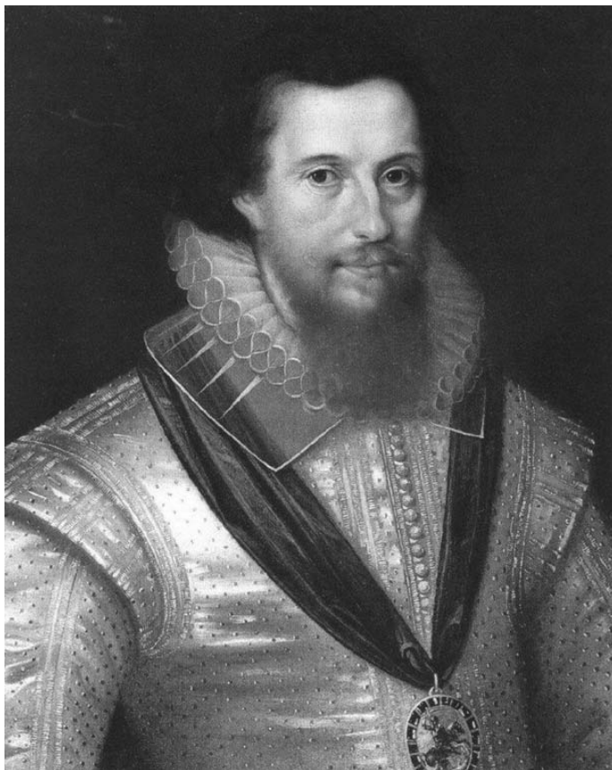
Marcus Gheeraerts, Ritratto di Robert Devereux, secondo conte di Essex , olio su tela, 1596 ca., London, National Portrait Gallery.

Robert Devereux (1566-1601) 11 , secondo earl of Essex', era il figliastro di Leicester, quel Robert Dudley che aveva già infiammato il cuore di Elisabetta anni addietro 12 . Forte di una naturale simpatia nei suoi confronti da parte della regnante, il ragazzo si era fatto strada nella corte londinese fino a diventare consigliere nel 1593. La cosa non mancò di creare rivalità e gelosie, nonché la spaccatura del Consiglio: da una parte i fautori della guerra e gli arrampicatori sociali della nuova gentry cittadina, che vide in Essex il suo rappresentante più in vista, dall'altra i vecchi consiglieri di più miti vedute – soprattutto nei difficili rapporti con la Spagna – guidati da Robert Cecil, il segretario di Stato.